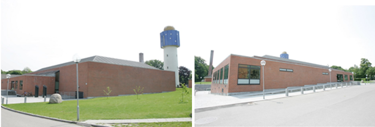
Billeder: Trollehallen set udefra, hvor tilbygningen skal ligge på det grønne areal.