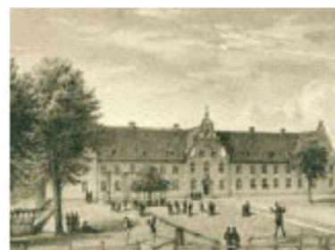
Grønneplads 1856, flankeret af skolebygning markeret med 3 svungne gavlpartier.

Disse tiltag vil fremhæve bygningens karakter – og samtidig forbedre sammenhængen mellem bygningerne og mellem grundskole- og gymnasieafdeling.