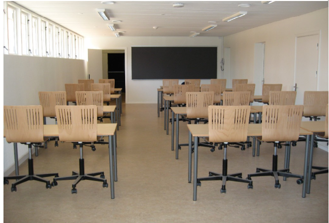
Billede: Det nyindrettede klasselokale