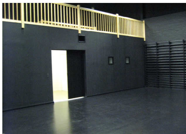
Billede: Det færdige repos samt teknikrum.

Teatersalen er blevet indrettet til at kunne rumme op til 100 siddepladser, og for at varetage de fornødne sikkerhedsforanstaltninger er der lavet et ekstra ind/udgangsparti midt i salen. Dette kan selvfølgelig ligeledes anvendes i forskellige henseender i forbindelse med teaterforestillingerne.