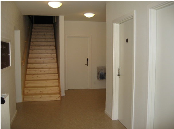
Billede: Det nye indgangsparti hvor der findes toiletter, indgang til teknikrum samt opgang til repos.

Størstedelen af teaterudstyret og møbler til teatersalen er blevet genbrugt fra tidligere. Der skal dog på et senere tidspunkt investeres i nyt teatertechnisk udstyr til omkring kr. 100.000.